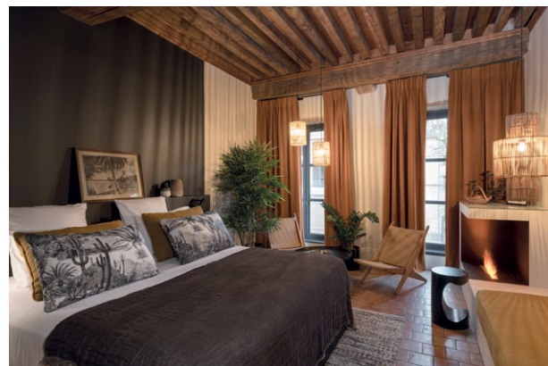
MiHotel, La Tour Rose à Lyon : les réservations via Internet sont devenues un enjeu majeur pour les hôteliers.

Travel Intelligence propose aux hôteliers de leur concevoir un site Web de réservation clés en main, installé « en trois minutes » et doté de toutes les fonctions nécessaires à la réservation en direct par le client (infos basiques, avis consommateurs, photos, meilleur prix garanti en temps réel, traduction automatique). Surtout, l'outil permet à l'hôtelier de réagir en temps réel en proposant ses prix en